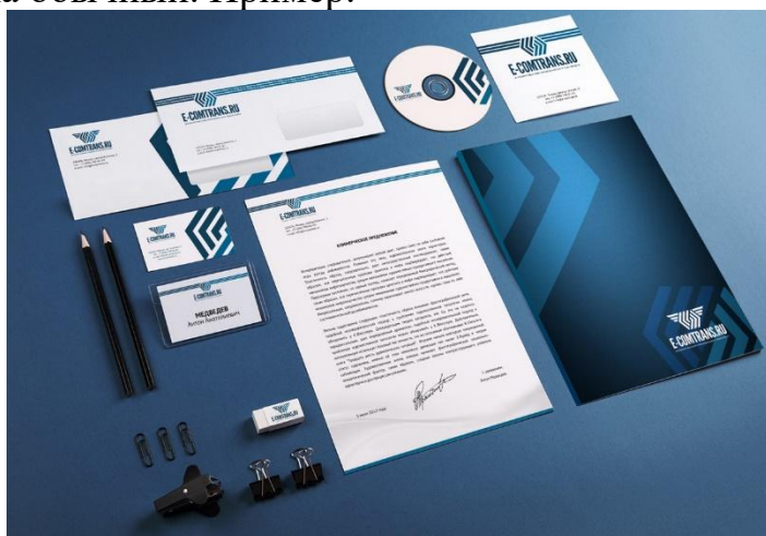
Рисунок 1.3.1. – Элементы фирменного стиля

Нумерация рисунков и таблиц трехуровневая: номер главы, номер параграфа, порядковый номер рисунка или таблицы внутри параграфа, например, – 1.3.1. Ссылаясь в тексте на рисунок, слово «рисунок» не пишется. Нужно писать, например, рисунок 1.3.1. Номер и название рисунка пишутся под рисунком по центру. Точка после названия рисунка не ставится. Шрифт названия рисунка обычный. Пример: